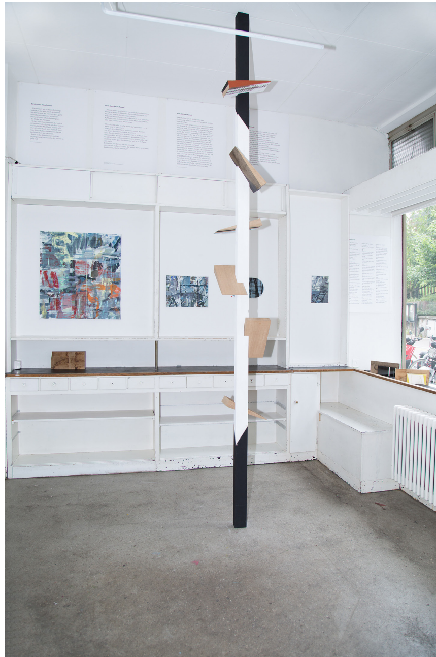
"Bildstehle" Eichenkeile Fichtenstehle 351 x 80 x 60 cm, Kalkkasein, Holzbeize, 2018