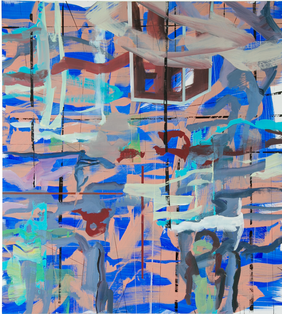
o.T. Ölfarbe auf Leinwand, 100 x 90 cm, 2023