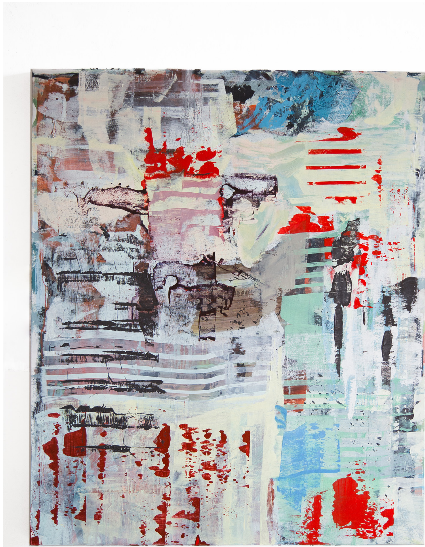
Re, Ölfarbe auf Leinwand, 90 x 100 cm, 2017