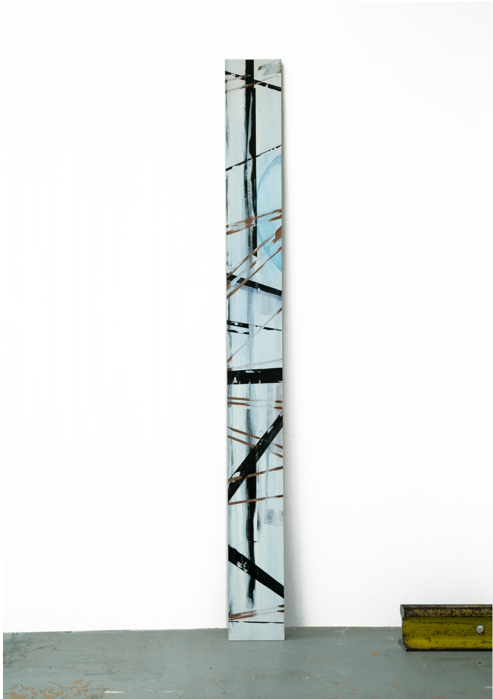
Bildstele, Tusche, Ölfarbe auf MDF, 2023