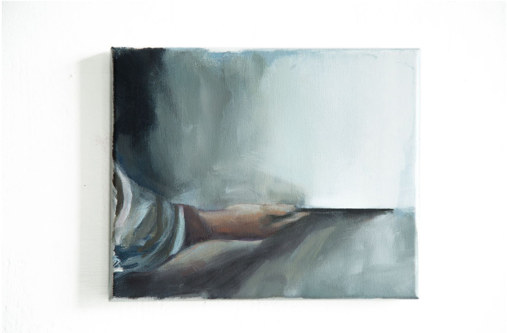
Thunder, nach Borremans, Olfarbe auf Leinwand, 27 x 22 cm, 2020