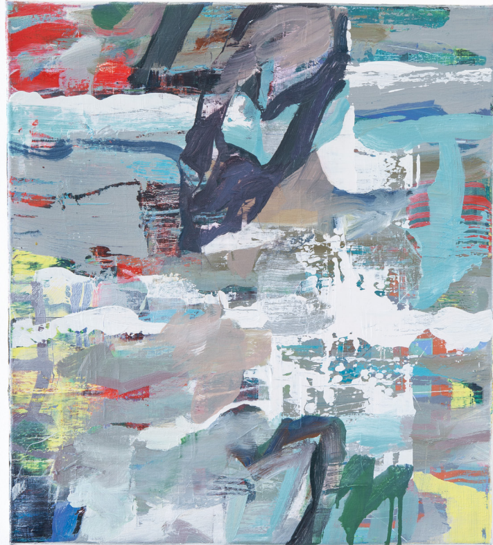
Geweih, Ölfarbe auf Leinwand, 48 x 43 cm, 2020