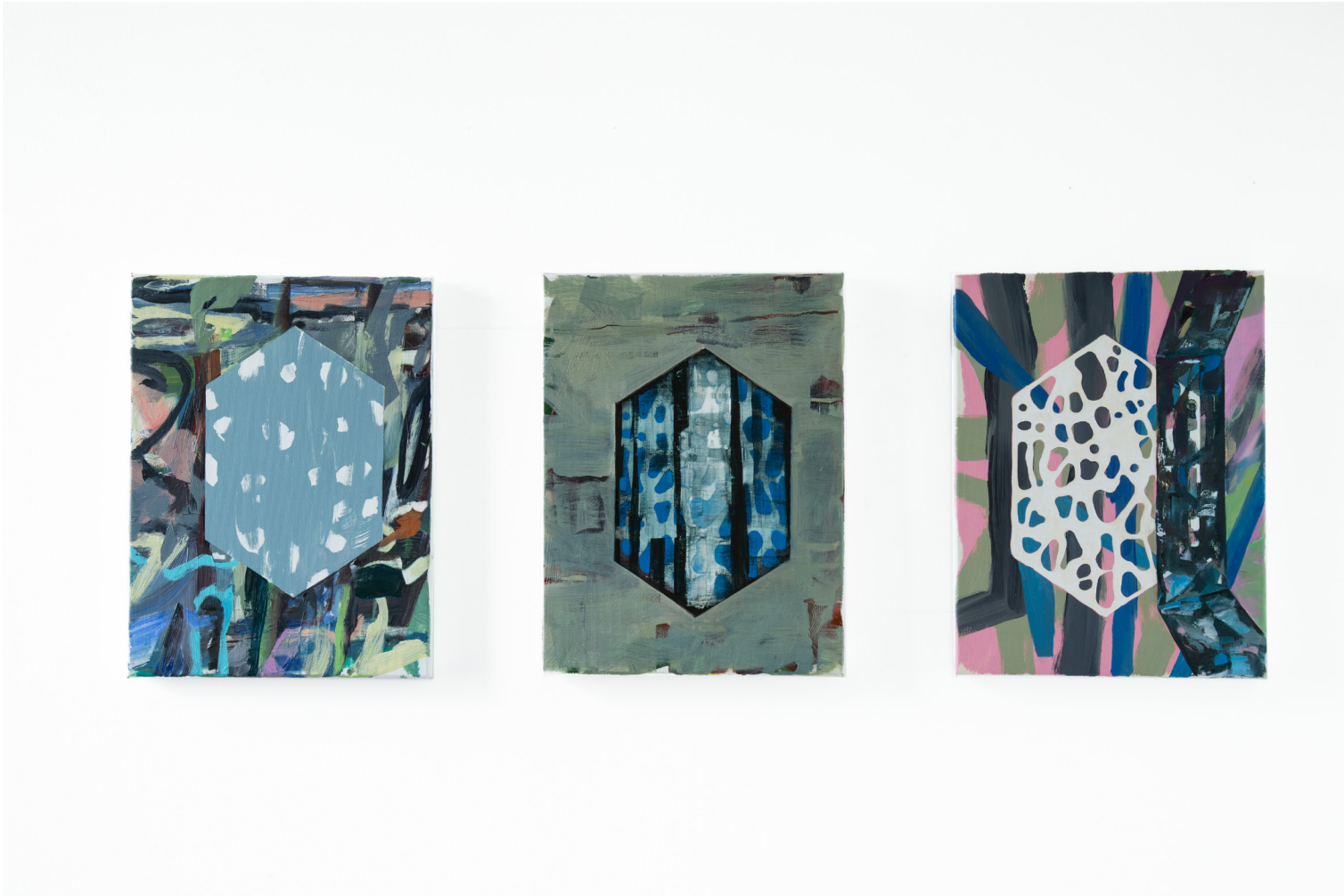
Verschwinden, Ölfarbe auf Leinwand, 30 x 40 cm, 2022