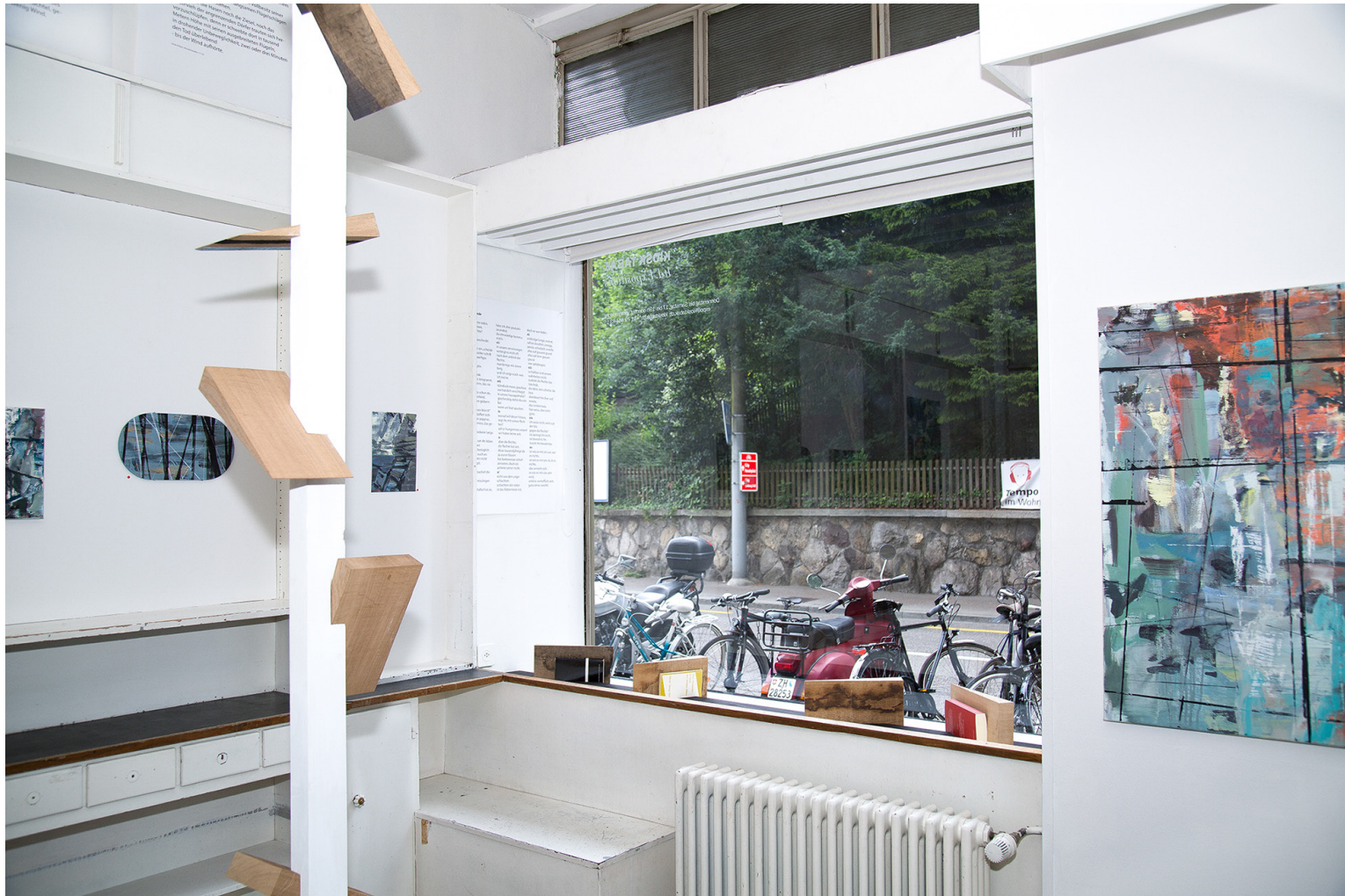
Ausstellung "Am Rande der Spur" im Kiosk Tabak Zürich, 8. - 29.6. 2018: Malerei, Zeichnung, Installation