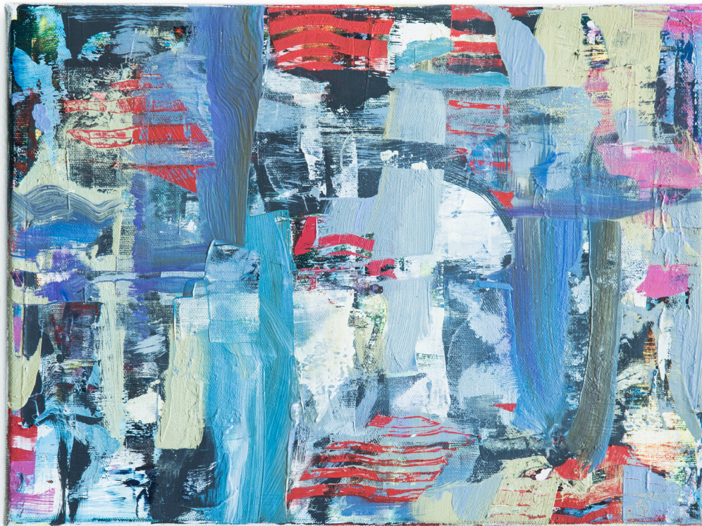
o.T., Ölfarbe auf Leinwand, 40 x 30 cm, 2020