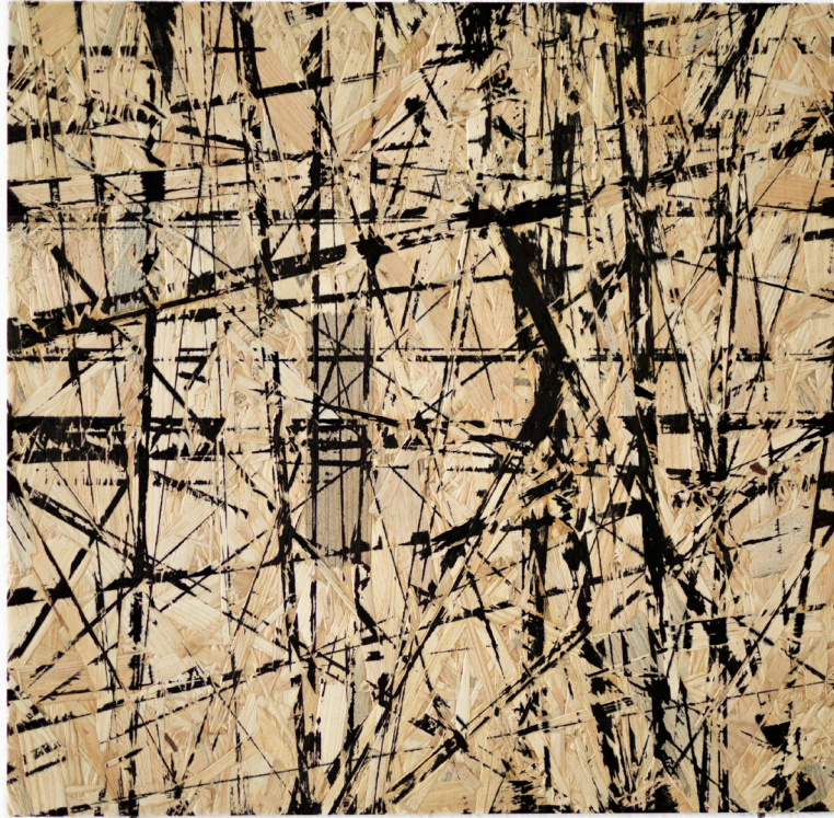
o.T. Tusche auf Pressspan, 2019