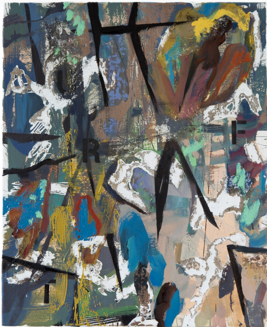
„FURT“, Ölfarbe auf Leinwand, 60 x 50 cm, 2021