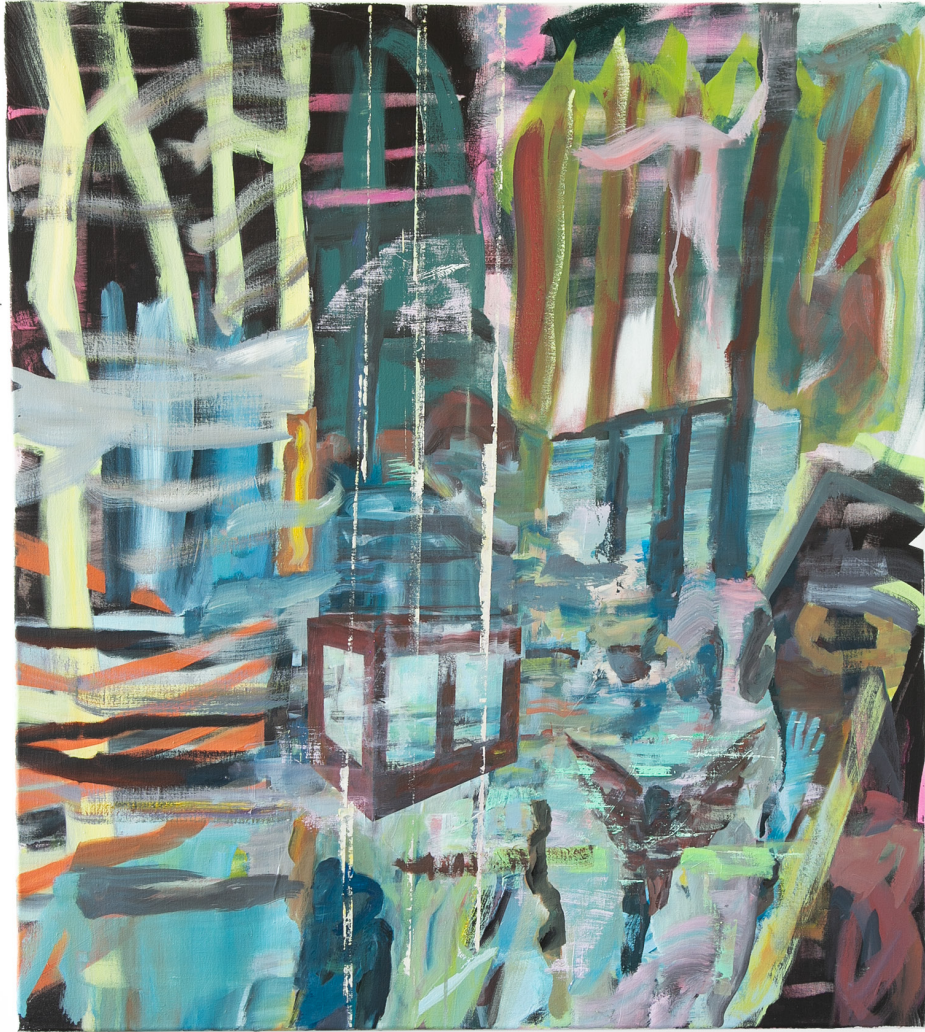
NYC, Ölfarbe auf Leinwand, 100 x 90 cm, 2023