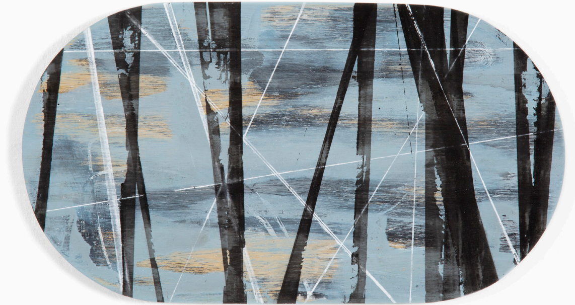
Meridian, Kalkasein, Tusche auf Holz 36 x 20 cm, 2018