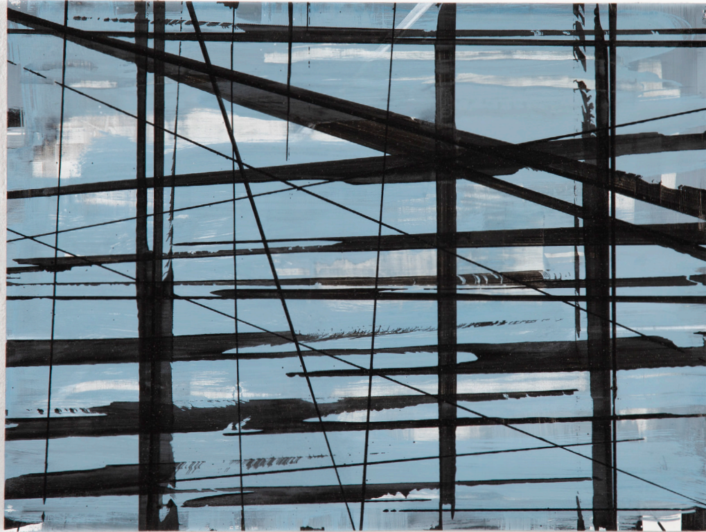
o.T. Acrylfarbe, Tusche auf Papier 57 x 40.5 cm, 2018