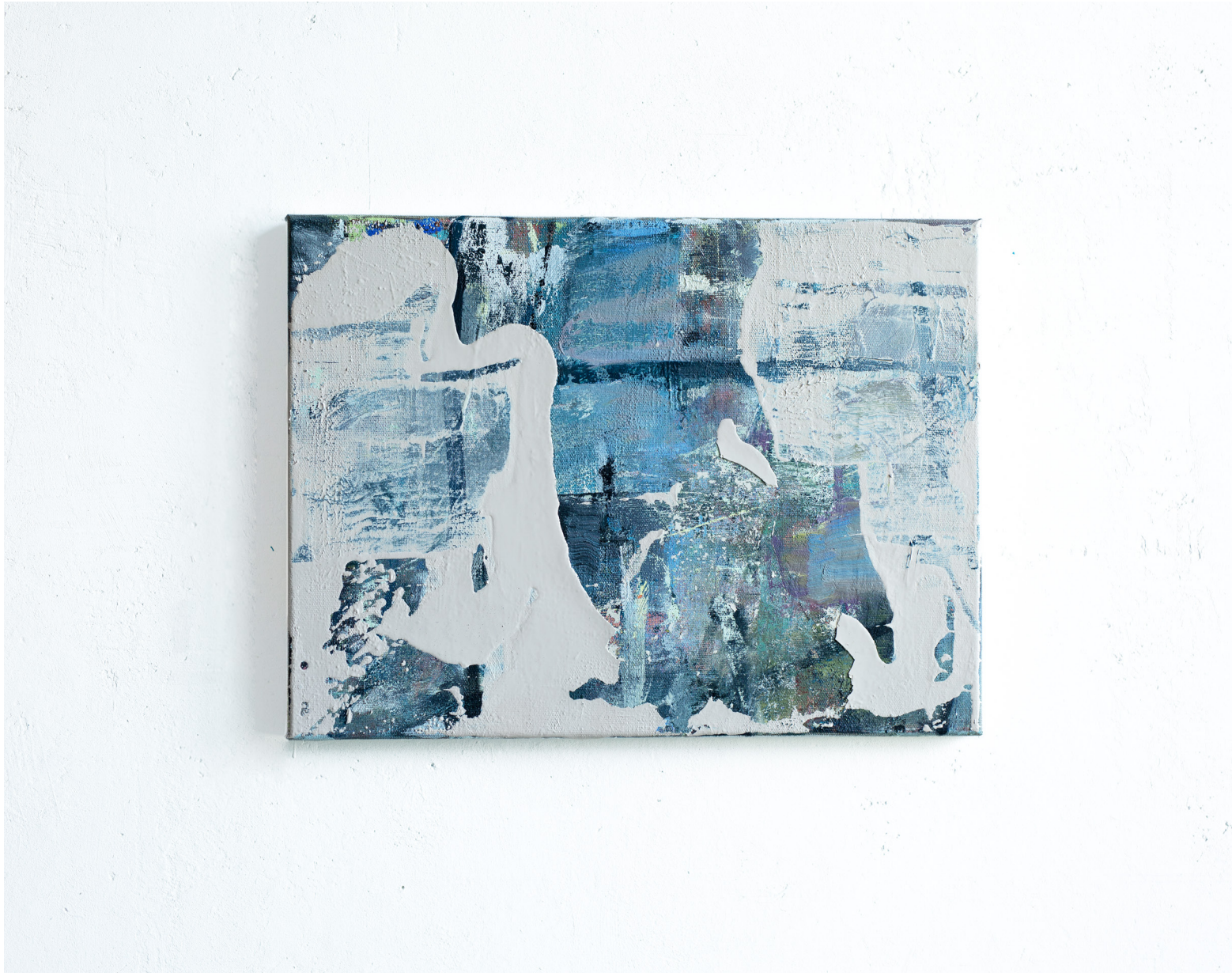
o.T. Ölfarbe u. Kunstharz auf Leinwand, 40 x 30 cm, 2019/20