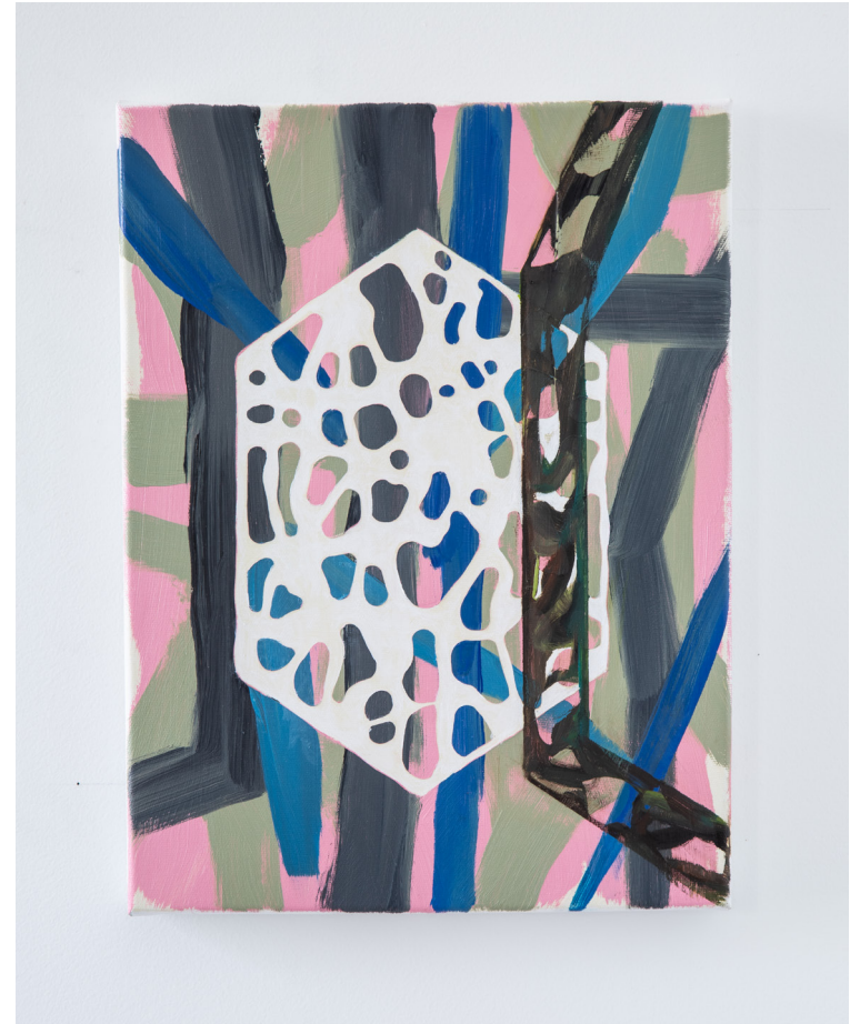
Verschwinden, Ölfarbe auf Leinwand, 30 x 40 cm, 2022