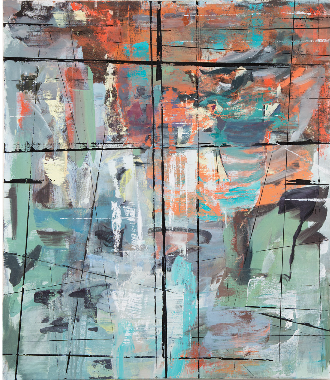
o.T. Ölfarbe auf Baumwolle 95 x 83 cm, 2018