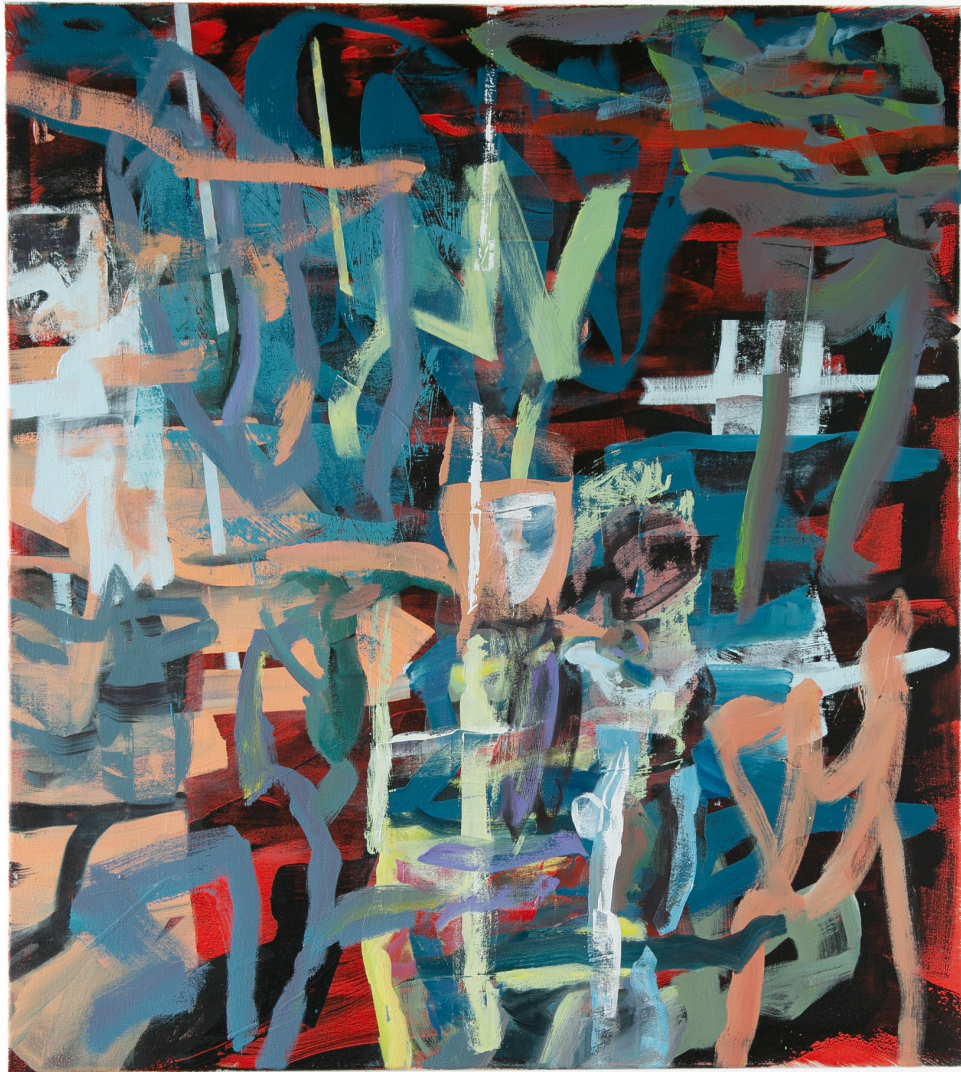
NYC 2, Ölfarbe auf Leinwand, 100 x 90 cm, 2023